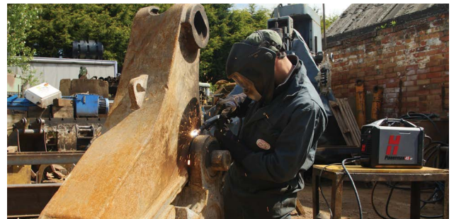
Техобслуживание и ремонт